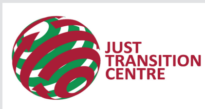
Центр справедливого перехода