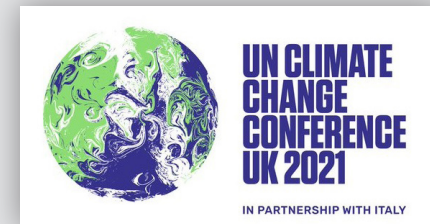
Конференция ООН по изменению климата

СПРАВЕДЛИВЫЙ ПЕРЕХОД – ЭТО ПУТЬ К ВЫСОКОЙ ЦЕЛИ: ДОСТОЙНЫЕ РАБОЧИЕ МЕСТА НА ЖИВОЙ ПЛАНЕТЕ