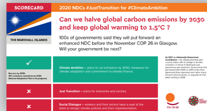
Система показателей NDC